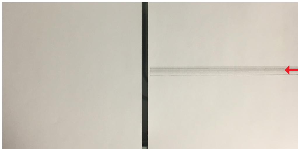
Beispiel: Original und Fehlerbild mit Streifen

Sollten Sie Streifen oder Unreinheiten in Ihrer Kopie entdecken, können Sie als erste Maßnahme alle Glasflächen mit einem trockenen oder leicht feuchtem Tuch reinigen.